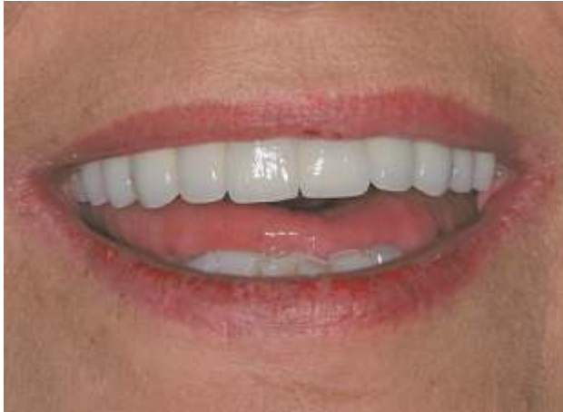
Abb. 11: Die zufriedene Patientin.

Obwohl sie ihre eingangs erwähnte Zahnbehandlungsangst bisher nicht ganz verloren hat, ist diese doch stark zurückgegangen und einem höheren Zahnbewusstsein gewichen.