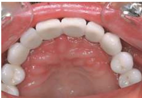
Abb. 9: Okklusalan sicht der Brücke in situ.