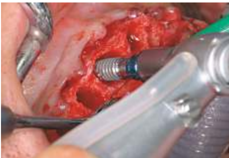
Abb. 3: Eindrehen des 3i-Implantats.