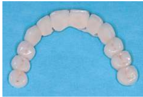
Abb. 8: Endgültige Versorgung mit einer VMK-Brücke, Okklusalan sicht.