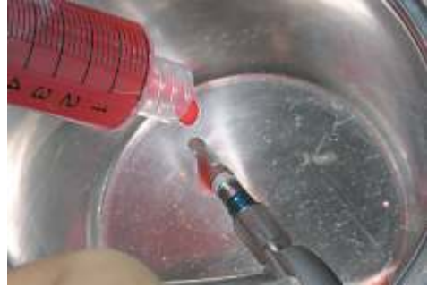
Abb. 2: PRP-Betropfeln der Implantatoberfläche.