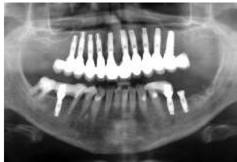
Abb. 10: OPG-Aufnahme nach der OP.

Zwölf Wochen später wurde die endgültige Präparation in beiden Kiefern durchgeführt und die Abdrücke für den definitiven Zahnersatz genommen. Die Eingliederung der Oberkieferbrücke und der Seitenzahnbrücken im Unterkiefer erfolgte drei Wochen später. Die Patientin wurde in das Recallsystem unserer Praxis aufgenommen.