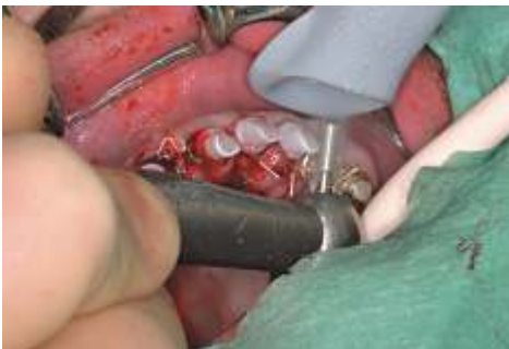
Abb. 5: Beschleifen der Pfosten unter starker Kühlung.