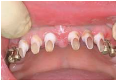
Abb. 7: Situ nach Entfernen der provisorischen Kronen.

Im Unterkiefer wurde zunächst kein Provisorium angefertigt. Die Einheilung verlief bis auf leichten Wundschmerz komplikationslos, die Nähte wurden zehn Tage später entfernt.