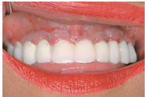
Abb. 6: Einige Tage nach der OP mit dem Provisorium (eingesetzt mit Temp Bond).