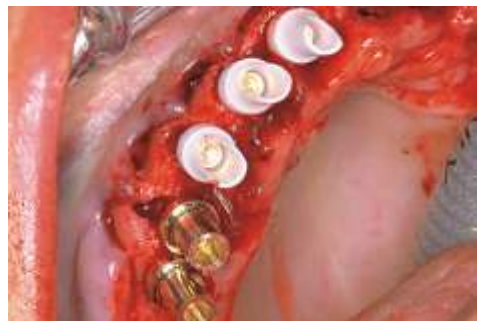
Abb. 4: Situ nach Einsetzen der Zirkon- und Goldpfosten.